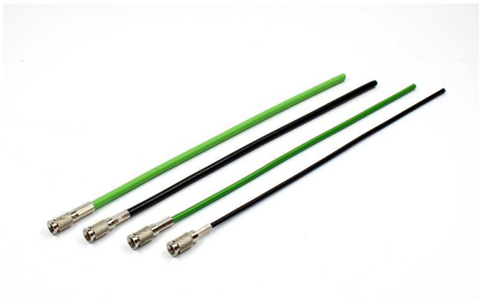
Abb. 3: Serie 1,0/2,3 Verbindungskabel mit Kabelsteckern und unterschiedliche Kabel

Diese Serie ist ebenfalls wie BNCpro für die Übertragungsformate HD, UHD und 4K (12G) geeignet.