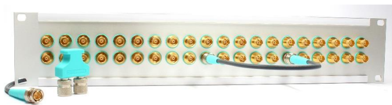
Abb. 2: BNCpro Steckfeld mit Verbindungskabel und Brückenstecker

In Verbindung mit hochwertigen Koaxialkabel wird sich BNCpro als „die BNC-Steckverbindung“ etablieren - davon sind wir überzeugt.