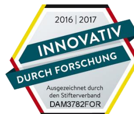
Abb. 7: Siegel für Innovativ durch Forschung