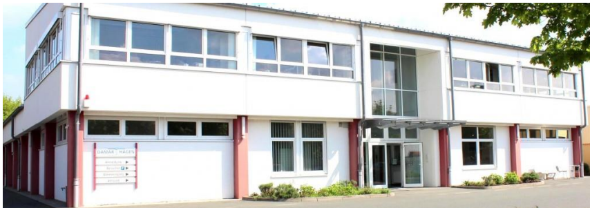
Abb. 6: Firmengebäude der Damar & Hagen Stecksysteme GmbH in Forchheim heute