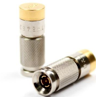
Abb. 4: Serie 1,0/2,3 Abschlussstecker