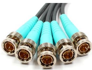
Abb. 1: BNCpro Verbindungskabel mit Kabelstecker

BNCpro wurde erfolgreich von der ARGE Rundfunk-Betriebstechnik hinsichtlich der HDTV-Tauglichkeit nach SMPTE 424M getestet.